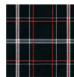
A22 黒チェック (ポリエステル)