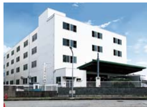
Kobe Second Factory