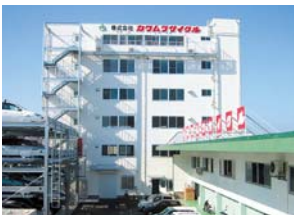
Head Office/Kobe Service Center