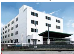
Kobe Second Factory